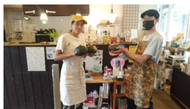
子ども食堂「わっか」